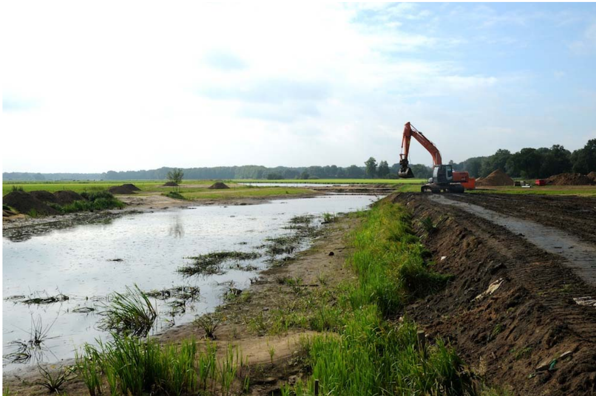
Ruimte voor de Vecht: ruimte voor water, natuur en versterking van de landbouw

De wateropgave voor het Vechtdal is onderdeel van Ruimte voor de Vecht. Er is een aantal waterprojecten opgezet die ten doel hebben om de rivier weer sterker te laten meanderen, de oevers natuurvriendelijk te maken (te 'ontstenen') en daarmee tegelijk waterbergingscapaciteit te creëren ( Uitvoeringsprogramma Vecht en Vechtdal 2009 ).