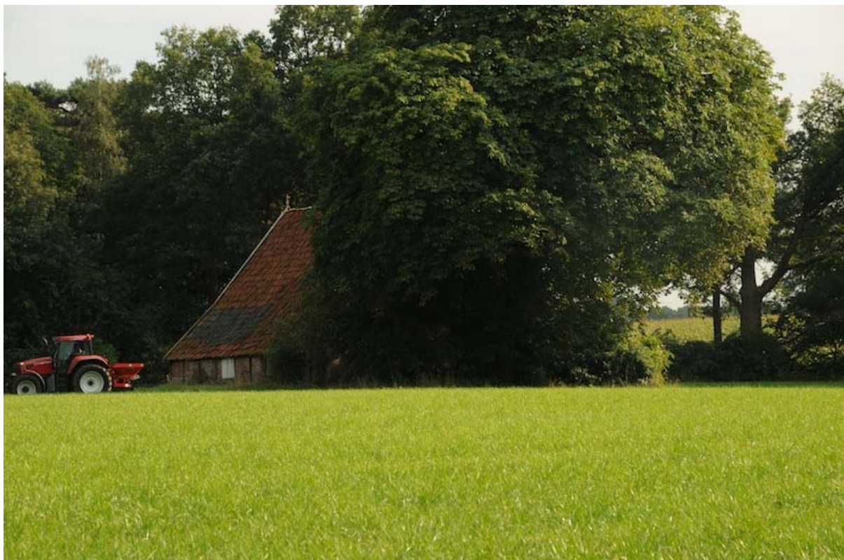
Noordoost-Twente: kleinschalig landschap met 3 à 4% 'groenblauwe dooradering'

Het Nationaal Landschap Noordoost-Twente is ruim 43.000 ha groot, waarvan zo'n 33.000 ha landbouwgrond. Het beeklandschap is kleinschalig en gevarieerd: een samenstel van beken, essen, kampen en ontginningen met daarin houtwallen, singels en (kleine) bossen. Natuur en water beslaan 12 à 15% van het gebied ( Ontwikkelingsperspectief 2006). Kijken we louter naar kleine landschapselementen (met bossen tot 5 ha), dan is het aandeel aan 'groenblauwe dooradering' 3 à 4% (Dijkstra & Griffioen 2002). Er zijn ruim 1.700 landbouwbedrijven actief, waarvan driekwart melkveebedrijven.