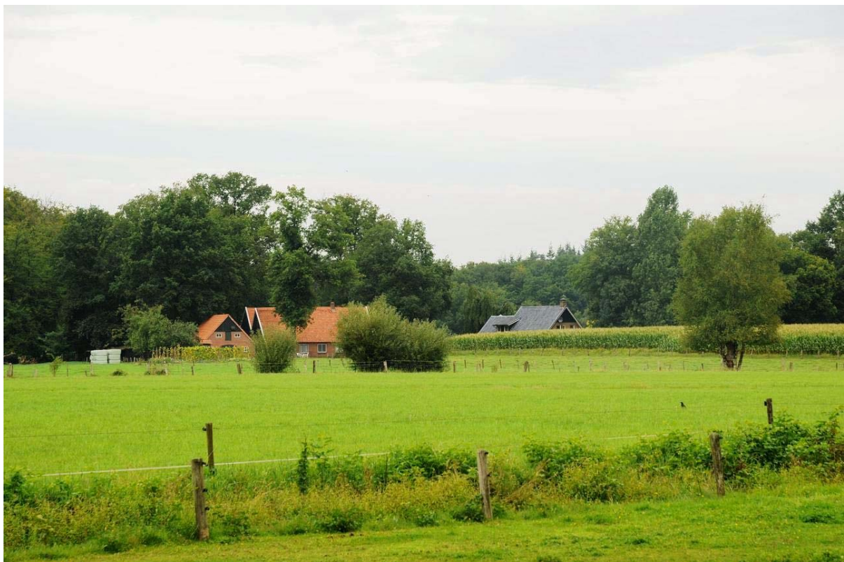
Voorwaarden voor succes: sturing op de situering en actief beheer van de vergroeningsoppervlakte

De twee gebieden waarin de verkenning heeft plaatsgevonden, hebben verschillende realiseringskansen voor de beschreven win-winsituaties. In NO-Twente liggen de kansen vooral in het meetellen van bestaand groen, vernatten van landbouwgrond voor Natura 2000 en inzet van landbouwgrond voor KRW-doelen langs waterlopen. In het Vechtdal is wat minder bestaand groen, al doet zich in Hardenberg op dit punt een belangrijke kans voor met de elementen die Staatsbosbeheer in de aanbieding heeft. Daarnaast liggen de kansen hier vooral bij de inzet van agrarisch natuurbeheer en door boeren beheerde natuurgronden als invulling van de EHS, bijvoorbeeld in het winterbed van de Vecht.