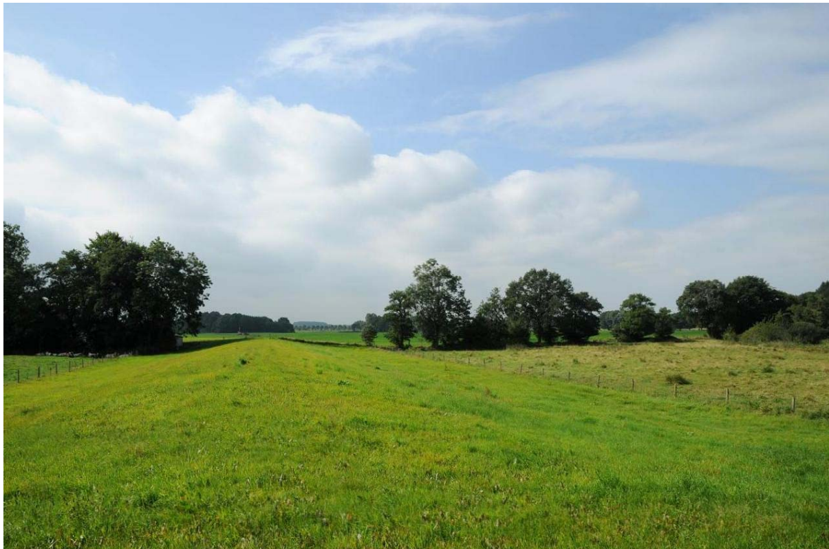
Stroomgebied van de Vecht: kansen voor kruisbestuiving met een (deels) agrarisch beheerde EHS