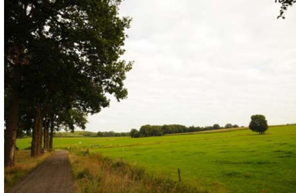
Alleen bij landschapselementen is er geen overlap tussen vergroeningspremie en beheervergoeding

Agrariër 1 meldt een bestaande houtwal aan als vergroeningsoppervlak en vraagt hierop teven SNL-subsidie aan. De vergroeningspremie bedraagt in dit geval (€ 125,- per ha omgerekend naar de verplichte 7% ecologisch oppervlak) € 1.785,- per ha ecologisch oppervlak. De SNL-vergoeding bedraagt € 2.666,- per jaar. Aangezien deze vergoeding geheel bestaat uit de kosten van de inzet van arbeid en materieel, is er geen overlap met de vergroeningspremie (die verdisconteert voor het feit dat er geen agrarische productie plaatsvindt). De agrariër ontvangt dan dus € 4.451,- per ha houtwal. In dit geval versterken vergroening en SNL elkaar dus in het voordeel van het landschapselement (beheergarantie) en de agrariër (extra vergoeding voor het grondbeslag van het element).