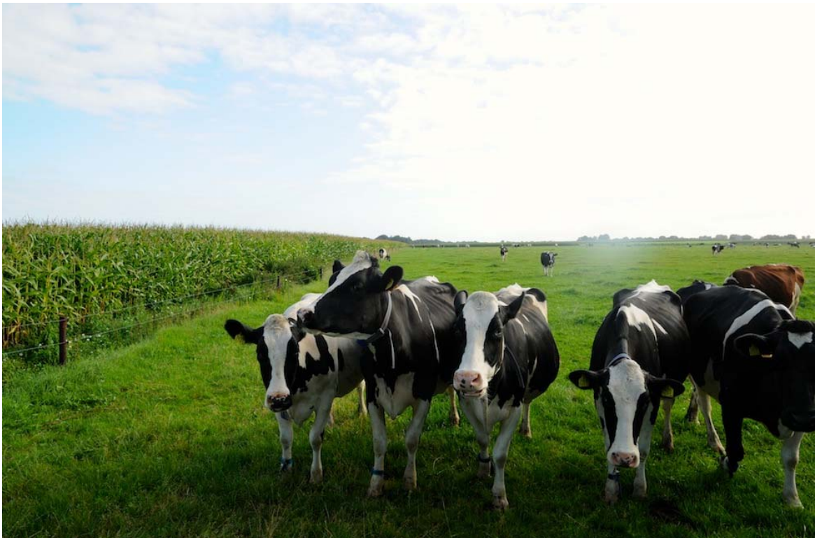
De invulling van de voorwaarde tot permanent grasland functioneert soms juist als een prikkel tot omzetting naar tijdelijk grasland

De meest urgente punten die de provincie, c.q. het IPO, zou kunnen bepleiten, zijn een goede regeling voor het meetellen van bestaande landschapselementen (punt d) en van gronden met natuurgericht beheer, maar met een (beperkte) productiefunctie (punt e). Een nieuw type groencertificaat maakt het laatste wellicht mogelijk. In dat geval is het zaak om dit zo vorm te geven dat er openingen blijven om bij te dragen aan regionale doelen (zie ook punt 6). Voor de stroomlijning van de lobby in Brussel is het van belang dat de provincie zijn speerpunten goed afstemt met het ministerie van EZ.